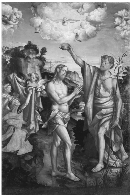
Fig. 5. Vincenzo Civerchio, Battesimo di Cristo , firmato e datato 1539, tempera e olio su tela, 255x173 cm, dalla chiesa di San Pietro martire dei Padri Domenicani, Crema. Lovere, Galleria dell'Accademia Tadini, P 36.

in Sant'Agostino e in San Pietro Martire/San Domenico e l' Adorazione dei Magi di Giovan Paolo Cavagna in Cattedrale. Gli appunti di Beltramelli, Pittori Bergamaschi , che sarebbero da riprendere per ricostruire i gusti di questo importante personaggio, sono editi in appendice all'edizione delle vite di Tassi curata da Franco Mazzini (F.M. TASSI, Vite , ed. cons. a cura di Mazzini, cit., II, 1970, pp. 149-185, in particolare pp. 159, 162, 163 per i passi in esame).