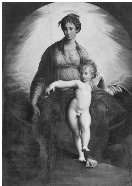
Fig. 8. Giovanni Battista Trotti, detto Malosso, Madonna con il Bambino , olio su tela, 206x146 cm (copia parziale da Parmigianino, Madonna con il Bambino, san Francesco e san Girolamo ), dal complesso di Sant'Agostino, Crema. Lovre, Galleria dell'Accademia Tadini, P 4.

La lettera, nella sua semplicità, rappresenta una vera e propria dichiarazione d'intenti non solo perché è tracciato il piano di quello che si andava nel frattempo definendo come il Museo Tadiniano, arricchito nel decennio seguente con prestigiosi acquisti condotti per lo più in Veneto, ma anche perché sono chiaramente enunciate le funzioni di conservazione e di fruizione pubblica che sono all'origine dell'odierna definizione di museo. Credo che queste finalità possano spiegare l'acquisto sistematico delle pale dalla soppressa chiesa domenicana di San Pietro martire 33 o dal