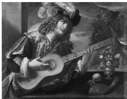
Fig. 4. Tomaso Pombioli, Suonatore di chitarra , opera datata 1636, olio su tela, 93x116 cm. Lovere, Galleria dell'Accademia Tadini, P 416.

Nel gennaio 1812 Tadini gli chiedeva di procurargli le Notizie d'opere di disegno nella prima metà del secolo XVI nell'edizione curata nel 1800 da Jacopo Morelli insieme alle Notizie delle pitture, e sculture d'Italia di Francesco Bartoli 25 . Questi dati sono importanti perché un'annotazione ripor-