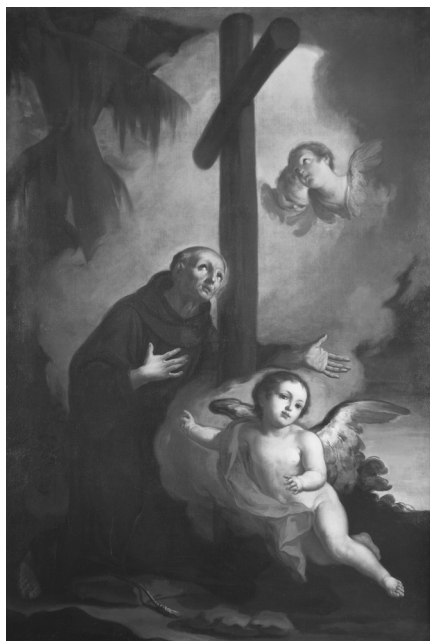
Fig. 9. Mauro Picenardi, San Pietro d'Alcantara , sec. XVIII fine, olio su tela, 205x140 cm. Lovere, Galleria dell'Accademia Tadini, P 457.

monastero agostiniano di Santa Monica 34 . L'utilità di procedere con gli accertamenti trova conferma nelle ricerche di don Giuseppe Pagliari che ha riconosciuto in un dipinto conservato nella collezione Tadini la pala dell'altare di San Francesco Saverio nella chiesa della Santissima Trinità a Crema attribuendolo al cremasco Giovanni Battista Brunelli. Il dipinto, del quale il conte Tadini conosceva il soggetto, apparteneva al primo assetto della cappella, affiancato dalle due tele dello stesso Brunelli con i miracoli del santo, La liberazione di una donna ossessa e La risurrezione di una donna defunta 35 . E a questo proposito, spiace che non sia ancora stata individuata la collocazione originale dell' Annunciazione e della