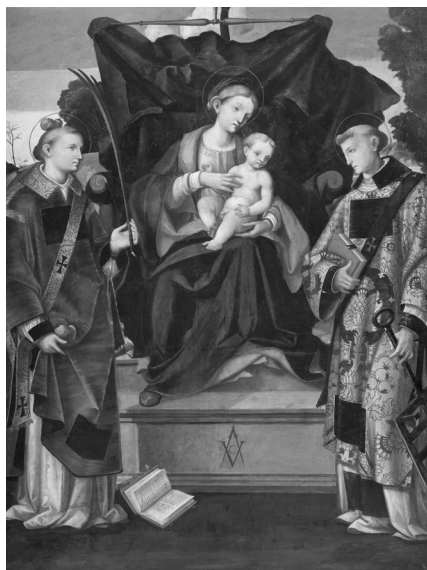
Fig. 6. Vincenzo Civerchio, Madonna col Bambino e i santi Stefano e Lorenzo , opera siglata VC e documentata al 1531, olio su tela, 217x168 cm, dalla chiesa di Santa Marta, Crema. Lovere, Galleria dell'Accademia Tadini, P 57.

propria collezione del Battesimo di Cristo di Civerchio e della Pala Manfron di Paris Bordon. Non è nota la data d'ingresso dell'opera di Civerchio (P 36, fig. 5), curiosamente non registrata da Crespi ma che grazie agli accertamenti di Mario Marubbi sappiamo provenire dal complesso domenicano. La presenza del cartiglio con firma e data ne facevano un'opera chiave per la ricostruzione del percorso del maestro, ma questo non riuscì a garantire il riconoscimento dell'autografia di un secondo dipinto, la Madonna con il Bambino e i santi Stefano e Lorenzo (P 57, fig. 6) già in Santa Marta. La pala è elencata tra le opere di Civerchio nel primo elenco dei pittori cremaschi e ancora nella Storia di Crema , ma il conte Tadini successivamente volle riferirla a Carlo Urbino per l'errata interpretazione della firma con la C che interseca il compasso 29 . La ricevuta del 26 marzo 1805 consente invece di datare l'acquisto della Pala Manfron di Paris Bordon dalla chiesa di Sant'Agostino (P 67, fig. 7) 30 . Scrivendo a Mau-