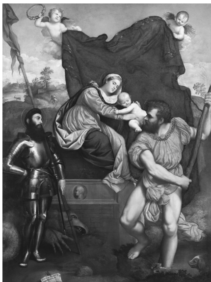
Fig. 7. Paris Bordone, Madonna col Bambino e santi Giorgio e Cristoforo (Pala Manfron), 1524-1526, olio su tela, 235x181 cm, da Sant'Agostino, Crema. Lovere, Galleria dell'Accademia Tadini, P 67.