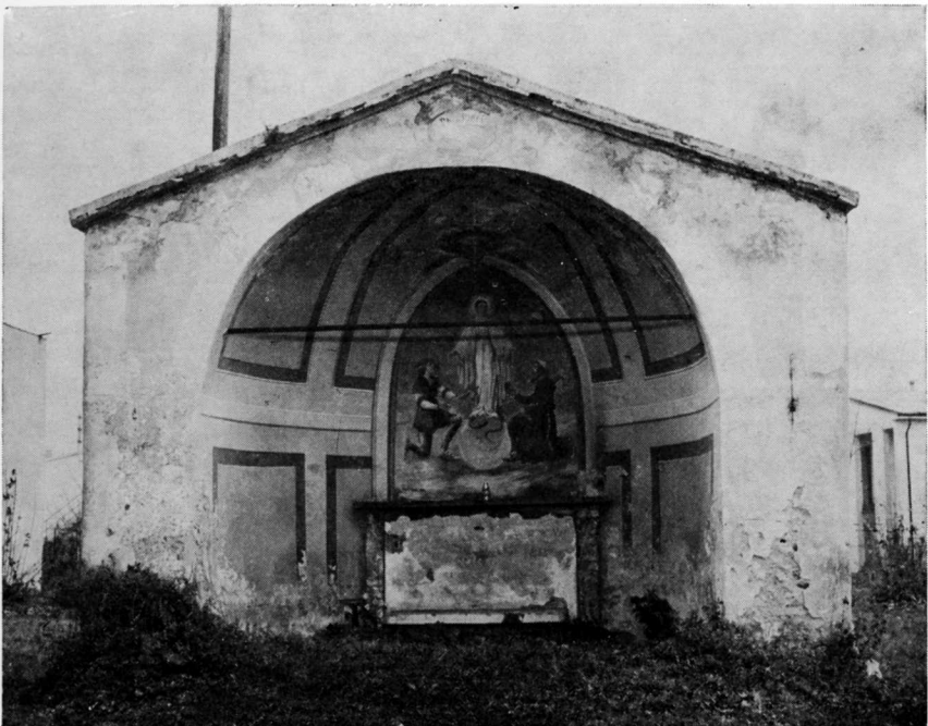
Fig. 1 - Ecco quanto rimane dell'antica Chiesa di S. Giorgio demolita nel 1824.

Rimangono la Chiesa Plebana e San Giorgio che continuerà la sua vita per alcuni secoli, fino alla demolizione che avvenne nel 1824 e che risparmiò solo la parte absidale trasformata in cappella, ancora oggi esistente ( foto 1 )